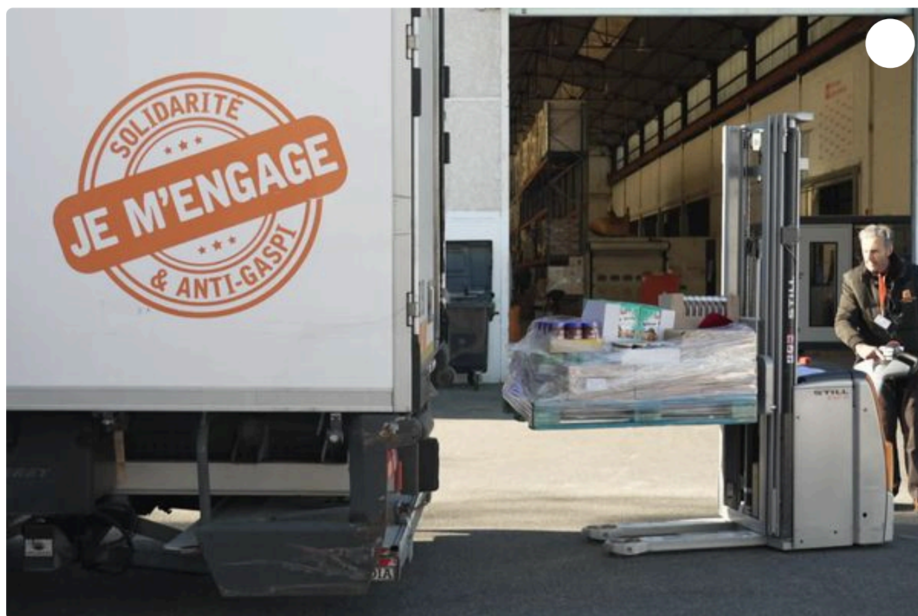
La Banque alimentaire du Rhône cherche encore des bénévoles pour sa grande collecte de ce week-end.